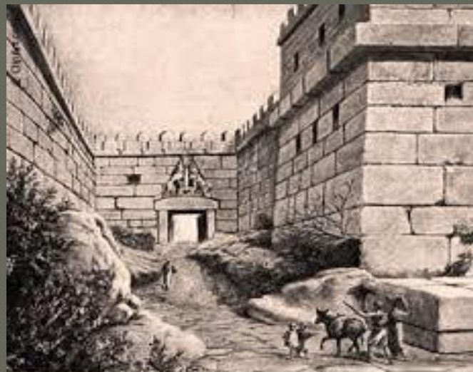
Mycenae: Lion's Gate (undated drawing)